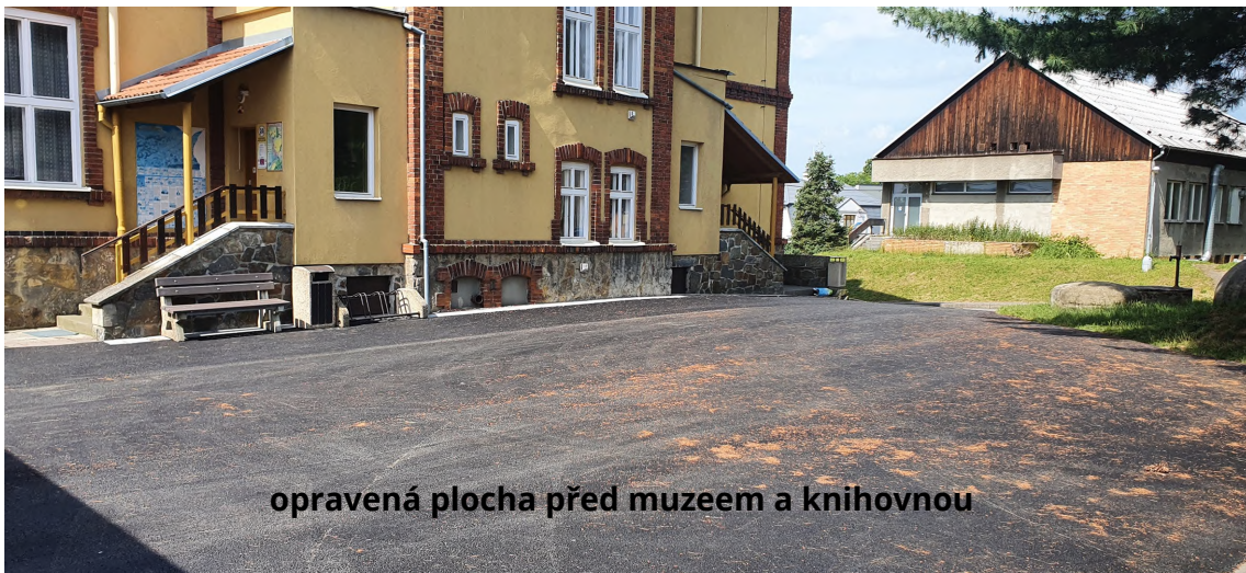
opravená plocha před muzeem a knihovnou