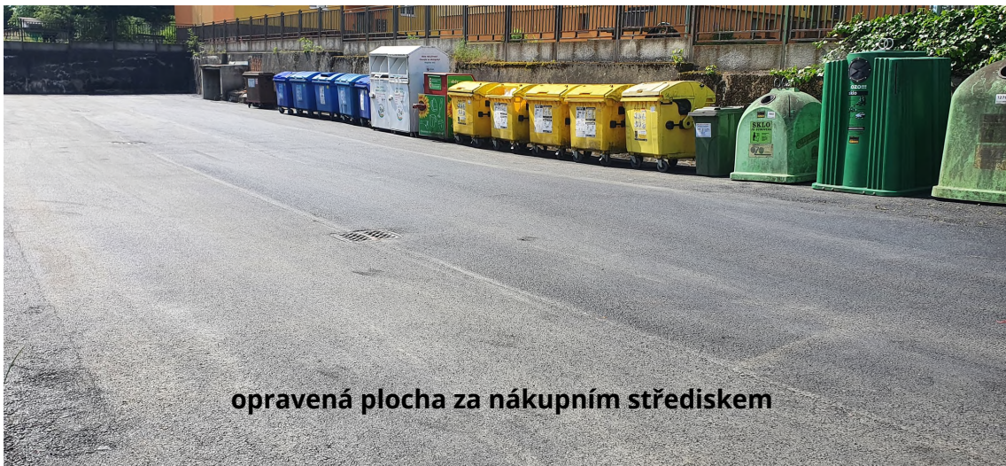
opravená plocha za nákupním střediskem