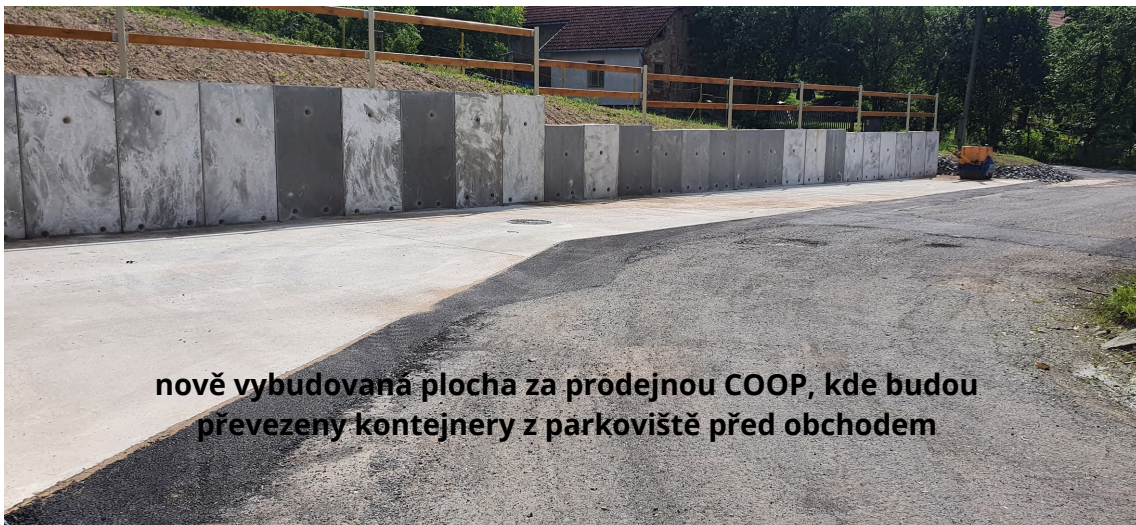
nově vybudovaná plocha za prodejnu COOP, kde budou převezeny kontejnery z parkoviště před obchodem